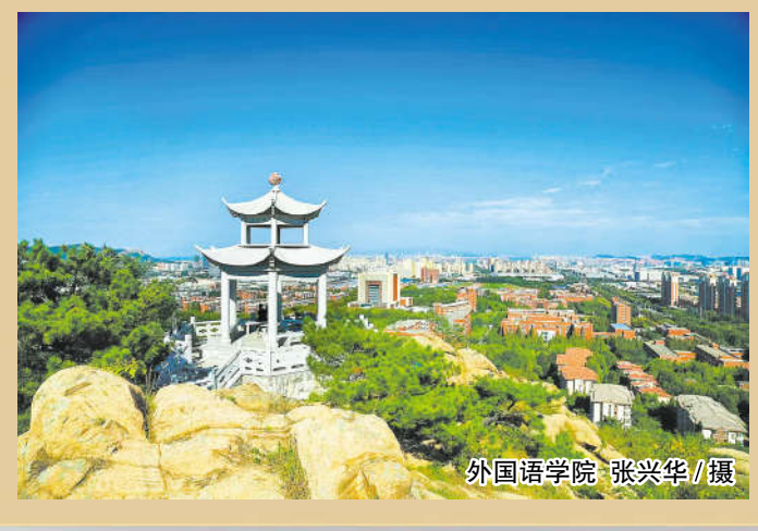
外国语学院 张兴华/摄