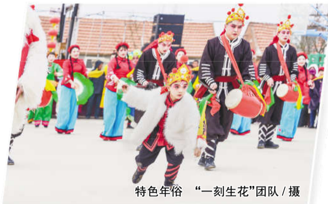
特色年俗

这不仅是一次艺术的展示,更是对乡村振兴事业的礼赞。本报特选登部分优秀摄影作品,以飨读者。