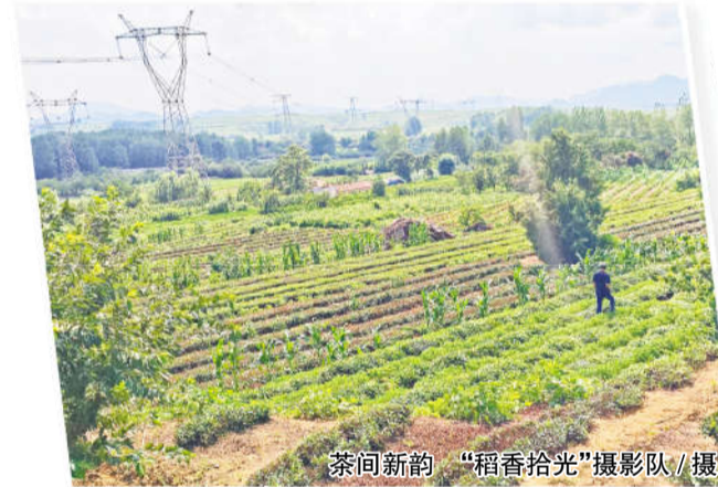
茶间新韵