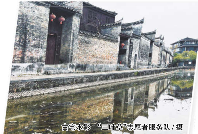
古宅水影