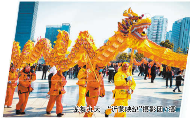
龙舞九天